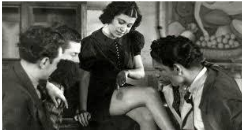
Escena imperdible donde una de las “chicas” enseña a sus amigos un moretón producto de una riña.

Sin lugar a dudas dentro del acervo del cine mexicano, “ La mancha de sangre ” representa una de sus más grandes leyendas , una película emblemática , tiene el suficiente material para que la crítica la haya considerado como la primer película erótica , basta como ejemplo observar durante 1 minuto con 20 segundos con música jazz un desnudo impecablemente erótico donde el camarógrafo hace una verdadera obra de arte, también tiene el “privilegio” de ser la primera película en ser censurada en este país , algunos críticos la califican como una de las pocas películas malditas que ha producido la cinematografía mexicana, otros hasta como el primer largometraje pornográfico, es indiscutiblemente una cinta que se adelantó a su época. Tan importante fue su valor cinematográfico que “ La mancha de sangre ” llegó a exhibirse en Europa en exclusivas salas de arte