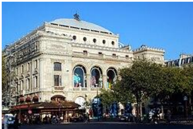
Théâtre du Châtelet en París

El punto clave del tango escénico fue el boom de los años 1950 , el cual se lo debemos a la excelente pareja de bailarines Juan Carlos Copes y María Nieves , considerados " los padres del tango escénico moderno " y revolucionario de este género. Ellos, inventaron la coreografía del tango , antes se improvisaba pero ellos armaron secuencias fijas para el escenario , combinando velocidad y firuletes, además introdujeron los famosos boleos altos, ganchos y saltos, sacrificando el abrazo cerrado para mayor impacto visual. En 1955 crearon " un primer espectáculo de tango danza " y lo presentaron con un éxito rotundo en los teatros Tabaris y El Nacional . De aquí la frase de Juan Carlos Copes " Hicimos del tango un espectáculo para exportar ".