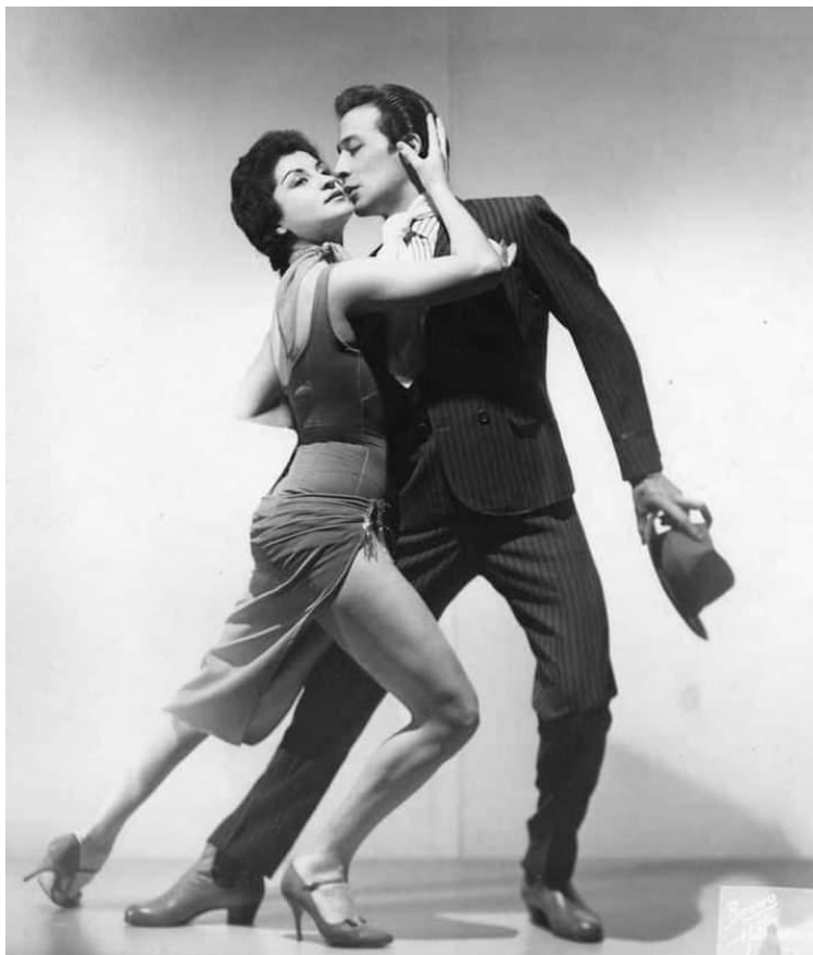
Juan Carlos Copes y María Nieves

Podemos decir con toda justeza que el Tango Escénico se mundializó principalmente gracias a estas parejas: