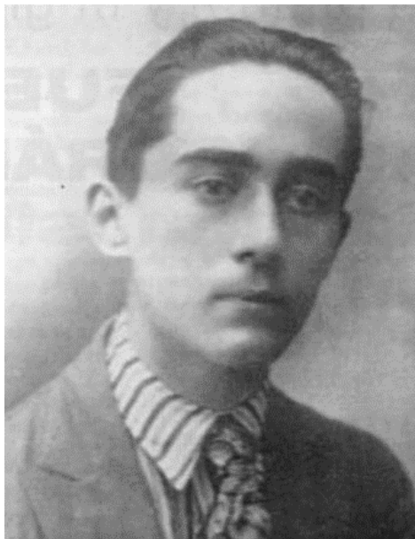
Alejandro García Caturla

La obra de Alejo Carpentier es fundamental en la historia musical de Cuba, su folclore y mitología afro-cubanos , esto último, íntimamente relacionado con el libreto de "MANITA EN EL SUELO".