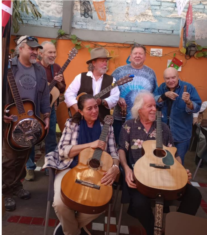
En la peña musical "Country Music, Blues & More"

Por ejemplo, en nuestro pasado evento, canté "Tu Recuerdo y Yo" del inmortal compositor José Alfredo Jiménez y "The Wild Side of Life" ("El Lado Salvaje de la Vida"), la versión del gran cantante Tex-Mex, Freddy Fender, con un verso en español. Doy gracias a Dios por todo nuestro éxito.