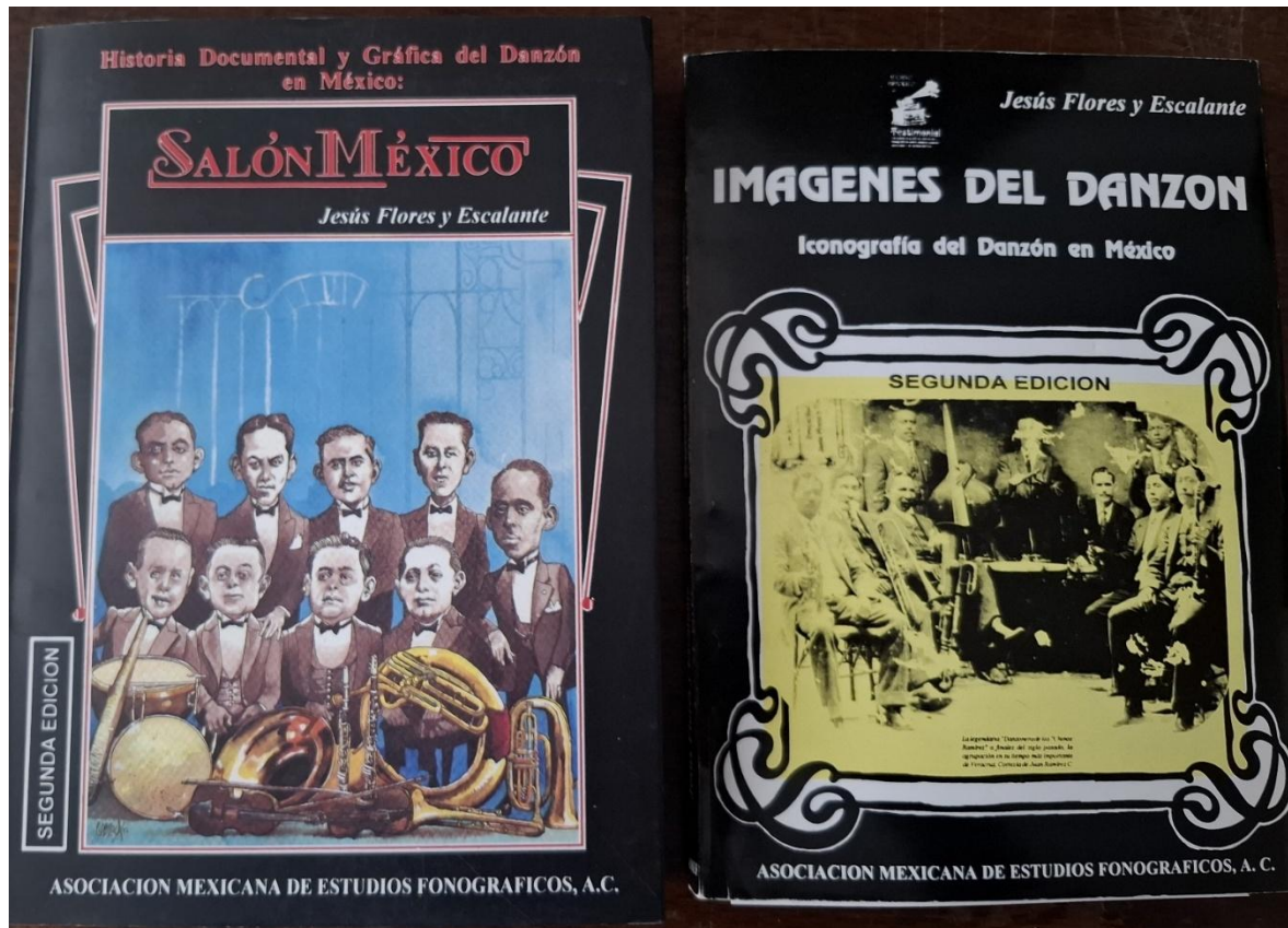
Portadas de los 2 libros antes mencionados.

En cuanto a su segundo libro, Imágenes del danzón, Iconografía del danzón en México , este, en mi opinión, vendría siendo un importante complemento del libro antes mencionado. Su primera edición fue en octubre de 1994 y la segunda edición data de abril del 2006 y consta de 190 páginas. Destacan en este libro, aparte de sus interesantes artículos, un excelente catálogo de fotos históricas