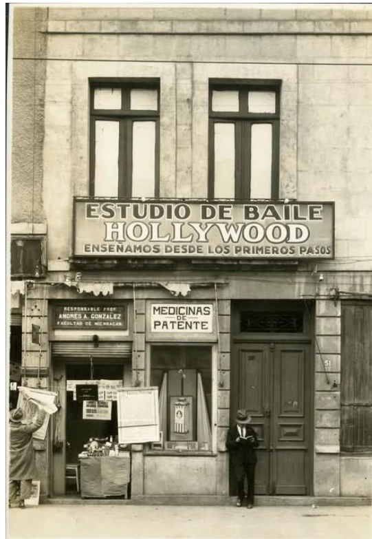
Año 1928, "Estudio de Baile "Hollywood" en la Calle de Santa María la Redonda 51a, hoy Eje Central Lázaro Cárdenas. CDMX