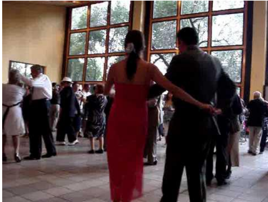
Foto obtenida de internet donde se puede apreciar los enormes ventanales de la fachada sur del Salón Atzín.

A pesar de no ser propiamente un “Salón de Baile” , su adaptación fue bastante acertada, lo primordial es tener un equilibrio entre el área de pista de baile y el área destinada para mesas, esto es un factor muy importante ya que se le da prioridad al baile. Otra particularidad a destacar es su enorme ventanal que cubre casi la totalidad de la fachada sur, lo cual permitía bailar las dos primeras tandas con luz natural y en ocasiones con el horario de verano hasta tres dejándose filtrar los rayos del sol hasta parte de la pista. El piso es de loseta blanca (un poco percutida por el desgaste y el factor tiempo) con juntas no a hueso, digamos que no es lo óptimo para una pista de baile, pero para los que nos gusta el baile, habiendo Danzonera en vivo hasta en piso empedrado “raspamos la suela” . El estrado que cubría todo el lado oriente del salón era suficiente para una sola orquesta por lo que obligaba a hacer intermedios de 20 minutos para el acomodo de atriles e instrumentos de la siguiente orquesta los cuales muy bien se aprovechaban para bailar otros ritmos con música grabada.