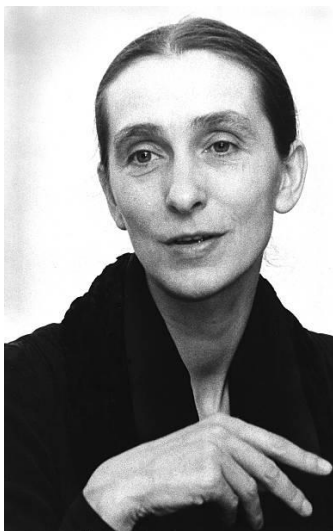
Philippine “Pina” Bausch

Dentro de los afamados y reconocidos coreógrafos a nivel internacional se encuentra la coreógrafa alemana Philippine “Pina” Bausch , que es considerada como una gran renovadora de la danza y no solo eso, ya que, según la opinión de los críticos expertos en materia, la llamaron: “La mejor coreógrafa del siglo XX” .