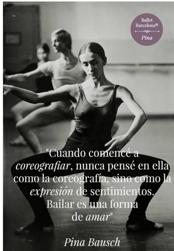
Pina Bausch en pleno ensayo y una de sus contundentes frases

Para entender de un modo abreviado el concepto coreográfico en las obras de Pina Bausch , enumero algunas de sus características :