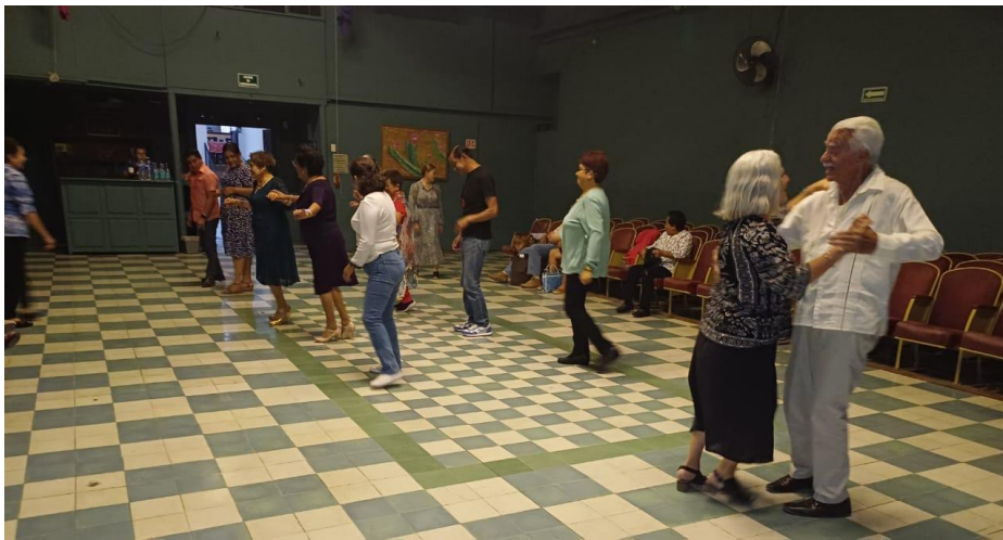
Bailando y tomando clases de danzón en el "Sindicato"

Todavía yo conservaba un evento musical no gubernamental, "Country Music, Blues & More", en un café, "Sabor Natura", en el centro de San Miguel. De Allende, tocamos y cantamos la música "gringa" pero, incluyendo algunas canciones mexicanas. Ahora, este año vamos a celebrar nuestro quinto aniversario y decidí tener más relación con el ámbito de la música norteamericana. Actualmente, hay muchos lugares con música que atrae a los "gringos" y, muchos músicos mexicanos tocan en ese ámbito. Yo soy "gringo", pero había pasado muchos años en actividades de música y baile preferidas por los mexicanos. En mis actividades culturales, yo tenía muy poca relación con mis paisanos. Ya que, había perdido mis actividades mexicanas, decidí a ampliar mi relación con la comunidad "expat" en el ámbito de la música, y lo estoy haciendo.