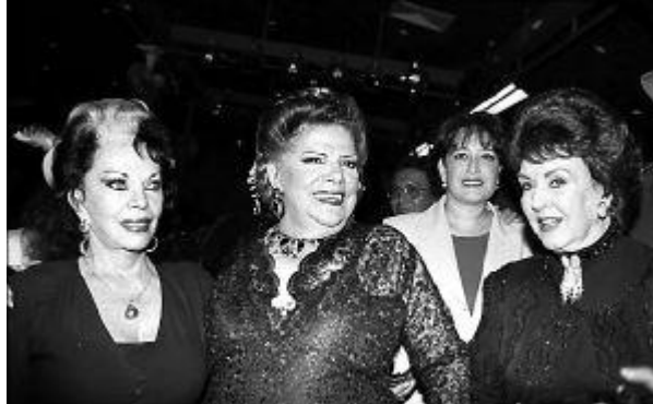
Foto histórica: Yolanda Montes "Tongolele", Ninón Sevilla y Marga López en el salón Tropicoso.

El 28 de junio de 2002 teniendo como sede el Salón Tropicoso , de la Ciudad de México se le rindió un homenaje a los 58 años del inicio de la filmación de la película " Aventurera " y algo muy digno de destacar fue la presencia de la actriz Marga López (primera actriz de la película Salón México ) y de la Bailarina Yolanda Montes , " Tongolele " quienes bailaron el Danzón " Juarez " ( en mi opinión lo más indicado hubiera sido haber bailado el danzón Ninón Sevilla ), para el deleite del público asistente y por supuesto de la misma homenajeada. Ninón Sevilla quien fue sin lugar a dudas, la primera, la única, la original, la genuina Aventurera , las demás han sido solo viles remedos.