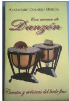
Portada de libro “Con Aroma de Danzón”