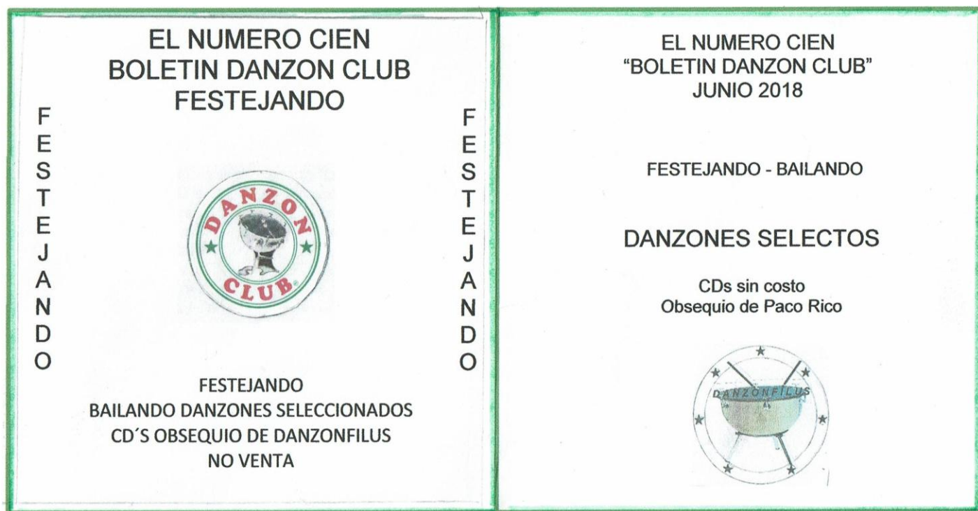
Portada y contraportada