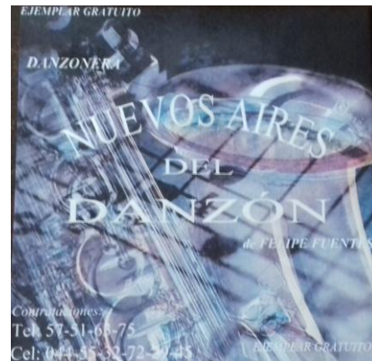
Portada CD promocional