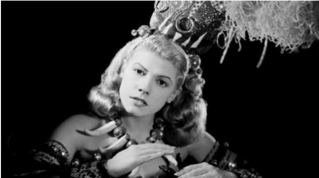
Ninón Sevilla “La Reina de las Rumberas

El mexicanísimo “ El cine de Rumberas ”, tuvo su inspiración en Los “Teatros de Revista” popularmente llamados “Teatros de Frivolidades”, también, en los espectáculos que se daban en las carpas allá por los años 1920 del siglo pasado, pero, hay que decirlo, “ las rumberas ”, fue una tradición que tuvo su origen en el teatro en Cuba y que pasó al cine, años más tarde, este concepto llegó a México y, aquí viene lo interesante, se considera que la película “ Siboney ” (1938), filmada en Cuba , protagonizada por la actriz y bailarina cubana, María Antonieta Pons y dirigida por su esposo el cineasta español Juan Orol (quien también participó como actor principal). Siboney , fue la primera película con la temática de “ rumberas ”, pero, la cinta que dio inicio en México a la producción masiva del “ Cine de Rumberas ” fue “ Humo en los Ojos ” (1946) dirigida por Alberto Gout y protagonizada por la actriz mexicana Meche Barba y David Silva, se dice que esta cinta sería protagonizada por María Antonieta Pons , pero, no se llegó a un arreglo con esta actriz.