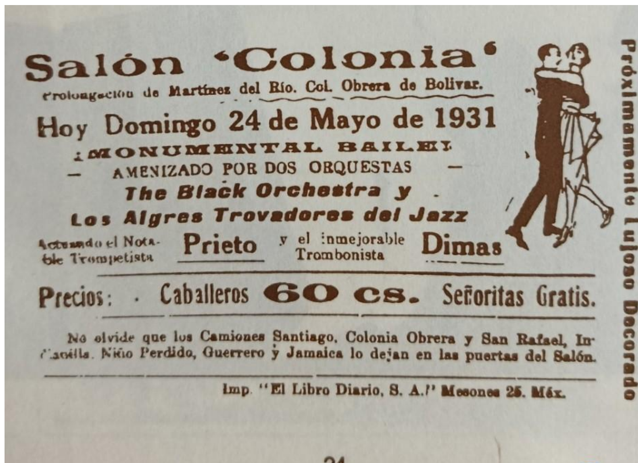
Una joya de volante publicitario del salón Colonia en 193.

DANZON CUBA. - Programa radial que se transmite todos los domingos de 8:30 a 9:30 am (tiempo de La Habana, Cuba, en México, de 7:30 a 8:30 am) por las frecuencias Radio Cadena Habana , audio real http://www.cadenahabana.icrt.cu/ con las mejores orquestas danzoneras. En sus secciones informativas, podrá conocer la programación de las orquestas danzoneras y de los diferentes clubs de amigos del danzón.