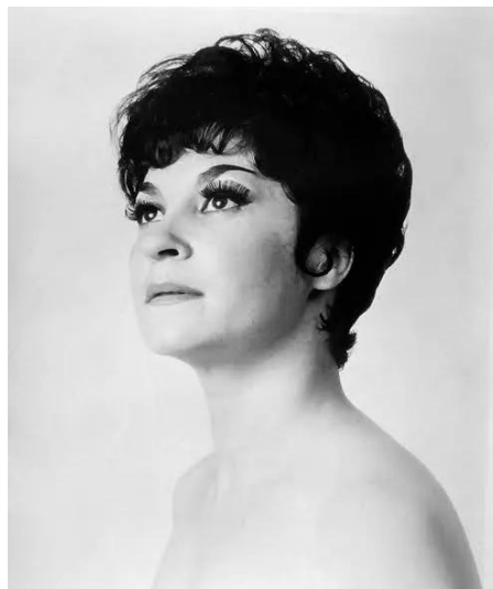
María Nieves Rego

El 19 de abril de 2026 falleció a la edad de 91 años en Buenos Aires Argentina la bailarina, milonguera ("Milonguera" mujer que asiste con frecuencia a milongas que son lugares de baile de tango) y coreógrafa de tango, María Nieves Rego considerada, por unanimidad, la mejor bailarina de tango que haya existido.